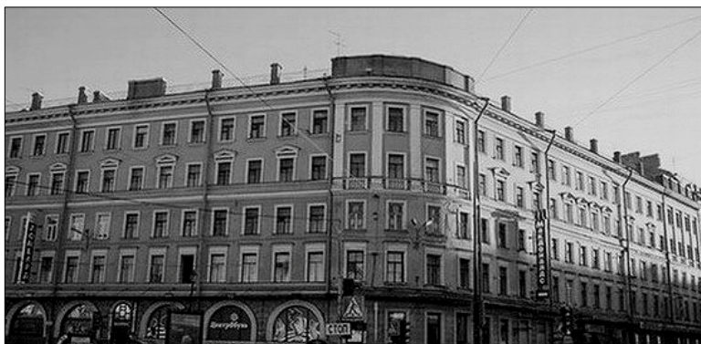
Единственное сохранившееся здание бывшей «Вяземской лавры» в Петербурге (современный вид)

рассказывали мне, что в крестьянских хижинах почти не знают различий между крестьянами и бродягами и что в холодные ночи все они сбиваются в кучу на высоких печных кладках. В городах они проживают в домах для бедных и в ночлежках. В Санкт-Петербурге такие места находятся главным образом на так называемой «Сенной», кварталах в пяти за Казанским собором. Здесь целые проулки и дворы отданы горюнам, и в одном только доме Вяземского* каждую ночь спят более десяти тысяч бродяг. Они могут возвращаться на свои нары в любой час дня и говорят о них как о своем dom – домашнем очаге. За «место» на этих деревянных скамьях берут тридцать пять копеек (около двадцати центов) в неделю, деньги платятся вперед.