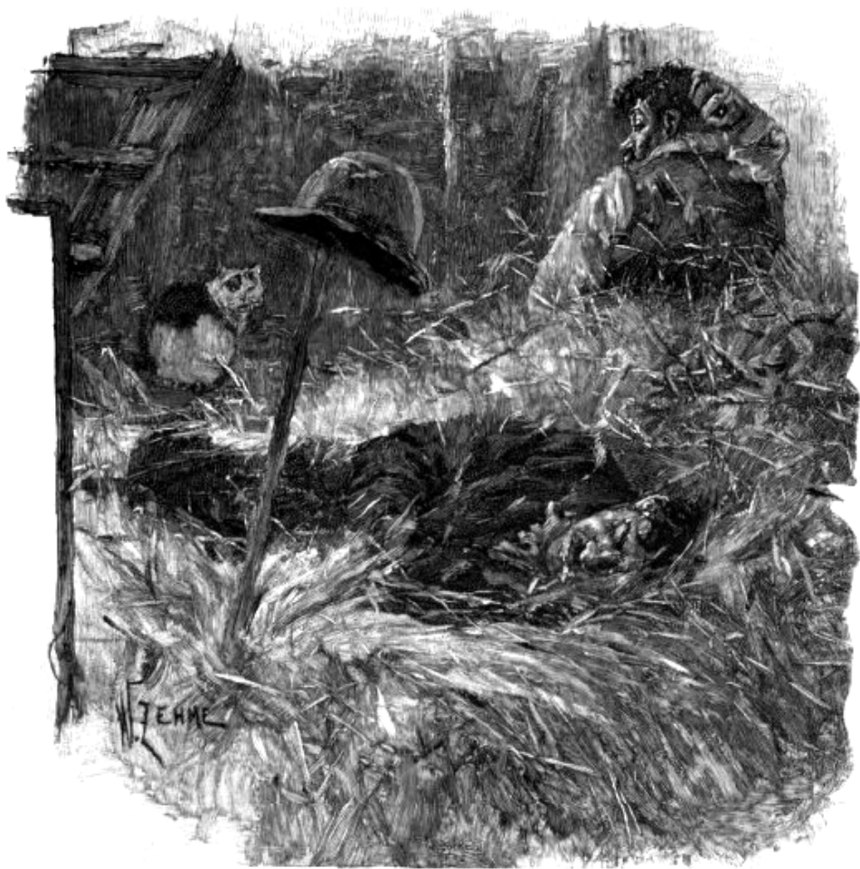
Ночевка на сеновале. Рисунок из книги Д. Флинта «Странствия с бродягами» (1899)