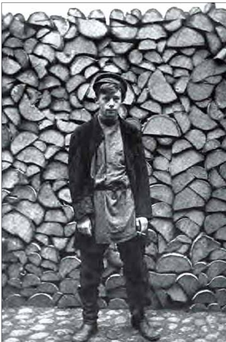
Джозайя Флинт в «костюме» русского бродяги. Санкт-Петербург (1897)