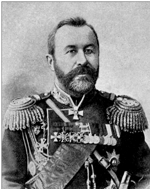
Ген. А. Н. Куропаткин в период русско-японской войны

ные корреспонденты не прилагают ни малейших усилий, чтобы отличить сплетни от фактов.